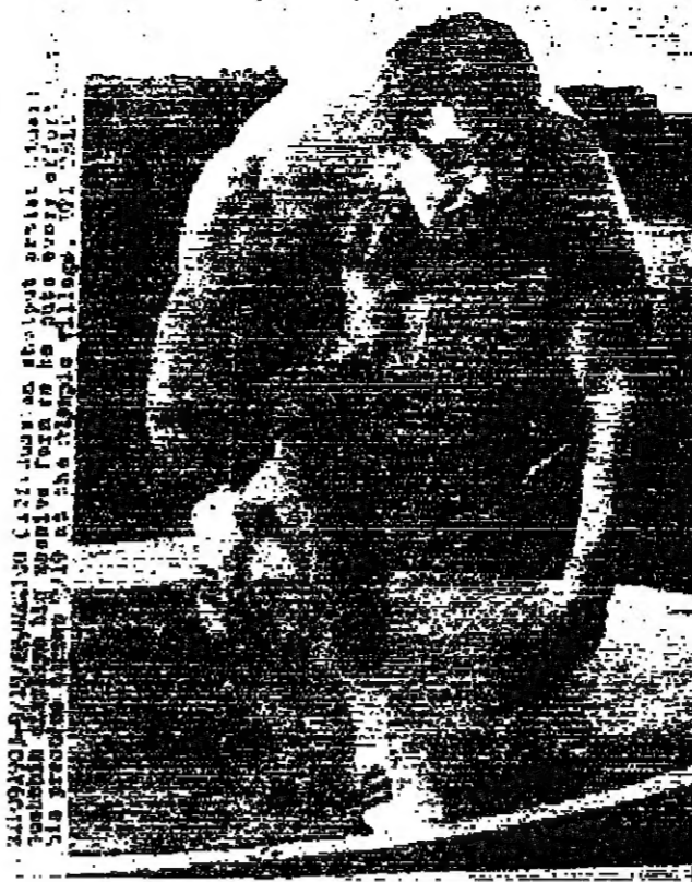
اللاعب الروسي ادوارد غوميشين يبرهن قوته الجنبية الهائلة خلال تدريباته على رمي الجلة في مدينة الألعاب الأولمبية في المكسيك

رئاسة اركان الجيش العربي بحلجة الى لوزان سلكية ، فعلى المعهدين الراغبين بدخول المناقصات الرجاء قيادة سلاح اللامسلكي الملكي في رئاسة الأركان واتناء ساعات الدوام الرسمي للإطلاع على المواد المطلوبة . يقبل التناقصات من اليوم وحتى الساعة التاسعة من صباح يوم الثلاثاء الموافق ٢٤ تشرين أول ١٩٦٨ .